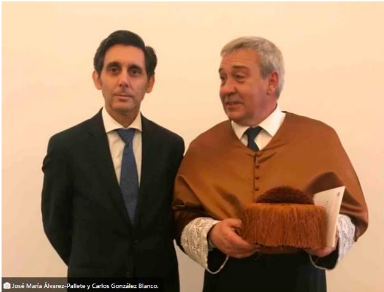
© José María Álvarez-Pallete y Carlos González Blanco.